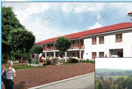
Domov u rybníka Víceměřice, příspěvková organizace

Dopolední program byl doprovázen hudebním vystoupením Divadla Slunečnice z Brna. Občané Víceměřic se mohou těšit na novou výstavbu, která bude symbolickým začátkem druhého století existence sociální služby v obci Víceměřice.